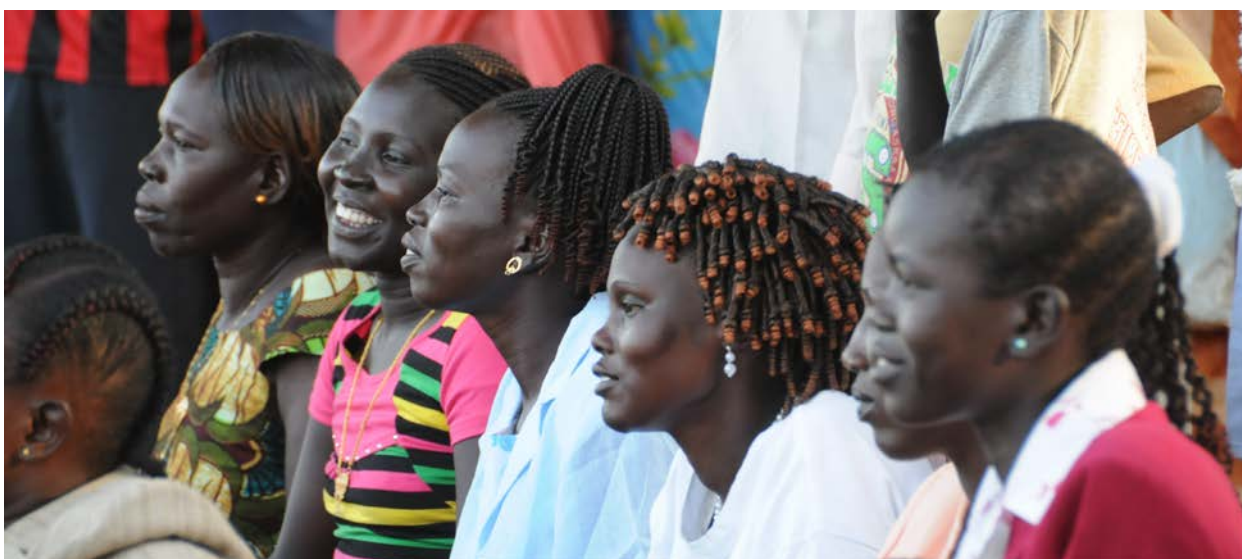
femmes au Soudan du Sud

De nombreux chantiers se profilent donc pour 2015. Le plus grand sera d'exploiter fructueusement la diversité des tailles, des missions et des régions d'origine des membres du KOFF et d'échanger avec les partenaires internationaux pour continuer d'innover.