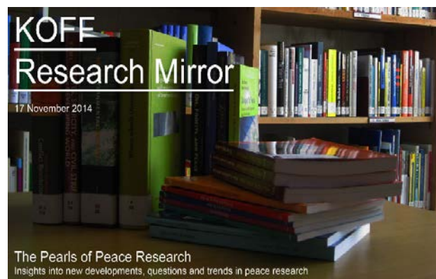
© swisspeace/Liliana Rossier, KOFF Research Mirror

propose et son champ d'expertise. Le site est également doté d'une base de données et d'une carte interactive permettant aux utilisateurs de visualiser rapidement mandats et régions d'activités des organisations membres.