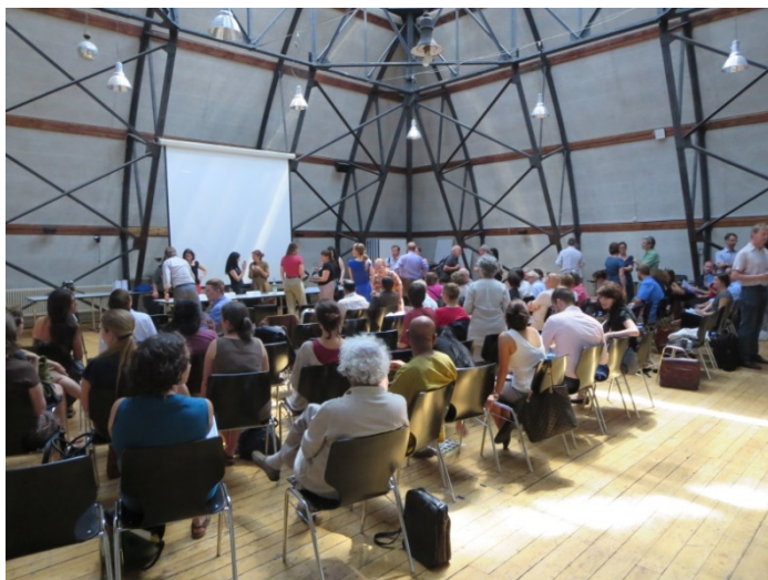
conférence « les défenseurs des droits humains en danger »

Une politique de paix active suppose et crée une marge de manœuvre pour les acteurs de la société civile. L'évolution sociale et politique vers une société équitable et pacifique n'est possible que si les différentes préoccupations peuvent être exprimées et négociées au cours de processus inclusifs. Sur le plan international, on observe pourtant une restriction croissante de cette marge de manœuvre, ce qui a des répercussions directes sur les défenseurs des droits de l'homme (DDH), qui luttent aussi bien pour leur propre cause que pour celles des autres. Partout dans le monde, ils sont victimes de menaces, de diffamations, de détentions et de condamnations arbitraires,