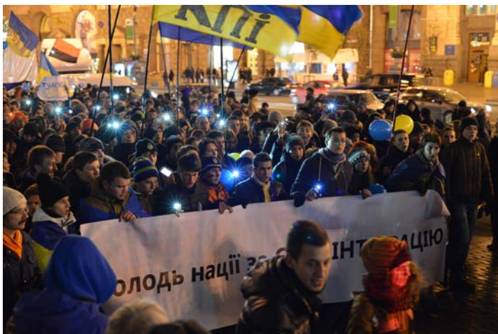
Proteste in der Ukraine

En 2014, la crise ukrainienne a marqué les esprits. En réaction aux événements qui se sont déroulés tout au long de l'année, le KOFF a choisi de se pencher sur cette région lors d'une série de tables rondes et de discussions. L'objectif : accorder et garantir un espace sûr de dialogue à la société civile ukrainienne et russe afin de débattre de leur rôle, non seulement dans la sortie de crise mais aussi et surtout dans la poursuite du programme de réformes nationales.