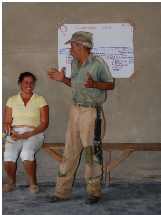
atelier avec les populations villageoises à Cuba

L'événement le plus marquant de ces dix dernières années en matière de genre et de promotion de la paix est la résolution 1325 de l'ONU. La Suisse, en consultation avec la société civile, a développé en 2007 un Plan national d'action (PNA), dont le KOFF a été chargé d'assurer le suivi au sein de la société civile. Par ailleurs, le KOFF a mis en place divers outils et instruments afin de favoriser une approche intégrée de la question du genre au sein de ses organisations membres. En outre, grâce à l'organisation de tables rondes thématiques, les participants ont pu remettre en question les images et les perceptions stéréotypées des rôles en fonction du sexe qui sont ancrées dans les politiques de paix et de sécurité, analyser la manière dont les victimes et les auteurs d'exactions sont perçus et l'impact de ces perceptions sur les décisions politiques, et discuter de questions comme l'influence des budgets sur la place des questions de genre dans la promotion de la paix.