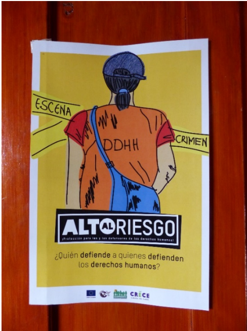
Affiche à Tocoa, Honduras

Au printemps, sur l'initiative de deux de ses organisations membres (l'EPER et Peace Watch Switzerland), le KOFF a lancé un processus d'apprentissage commun sur la « marge de manœuvre de la société civile au Honduras ». Le thème s'est imposé de lui-même car les récents développements politiques, juridiques, économiques et sociaux du pays compliquent de plus en plus le travail des organisations locales, nationales et internationales de la société civile. Avec cinq autres ONG suisses et le soutien de la DDC au Honduras, le KOFF s'est fixé pour objectif de mettre au point, à l'aide d'une méthode développée par l'Alliance ACT, une analyse participative et différenciée de la société civile hondurienne et de sa marge de manœuvre, ainsi que d'élaborer des stratégies communes visant à préserver et élargir cette marge.