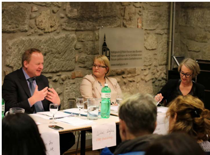
débat lors du symposium

Les exemples régionaux du Plan d'action national pour la mise en œuvre de la résolution 1325 de l'ONU (UNSCR 1325) rapportés par le DFAE font état de résultats encourageants. Dans la région des Grands Lacs par exemple, des organisations de femmes se mettent en place avec le soutien de la Suisse pour sécuriser l'environnement et améliorer l'accès aux prestations de base, en dépit des agressions perpétrées par les soldats de l'ONU sur les femmes et les adolescentes. Les conditions restent néanmoins difficiles, le contexte fragile et les traumatismes présents. Quinze ans après l'adoption de l'UNSCR 1325, les doutes sur sa capacité à changer les choses s'installent.