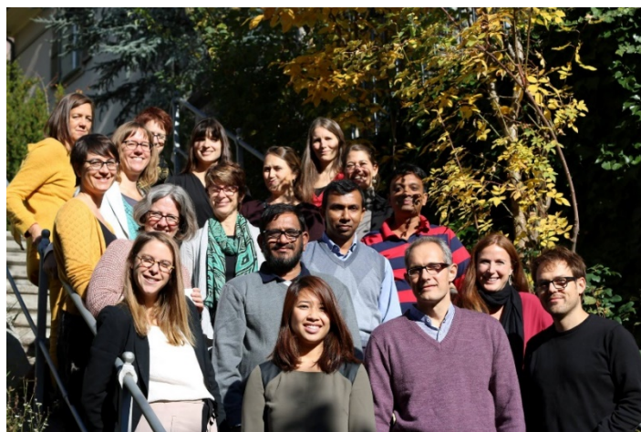
© KOFF, plateforme pour la communauté de la sensibilité aux conflits

Le KOFF a dirigé cette initiative de plateforme jusqu'à fin 2015. Jusqu'à ce que le financement extérieur du secrétariat soit assuré, les membres du groupe de travail assurent désormais à tour de rôle la coordination.