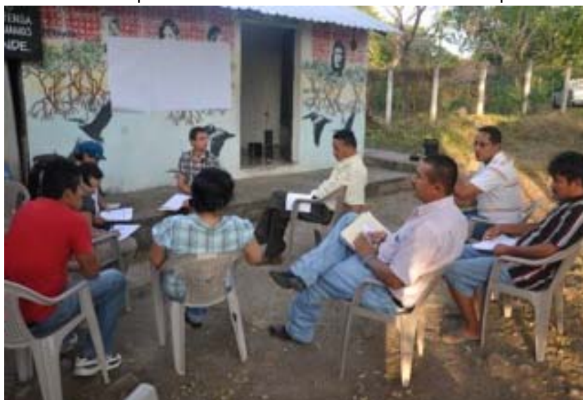
© KOFF / Marcel von Arx, Zacate Grande

L'Amérique centrale est la région qui connaît le taux le plus élevé de victimes de violence armée. Le contexte est caractérisé par des structures étatiques fragiles, une grande inégalité sociale, une discrimination persistante des groupes de populations indigènes, la