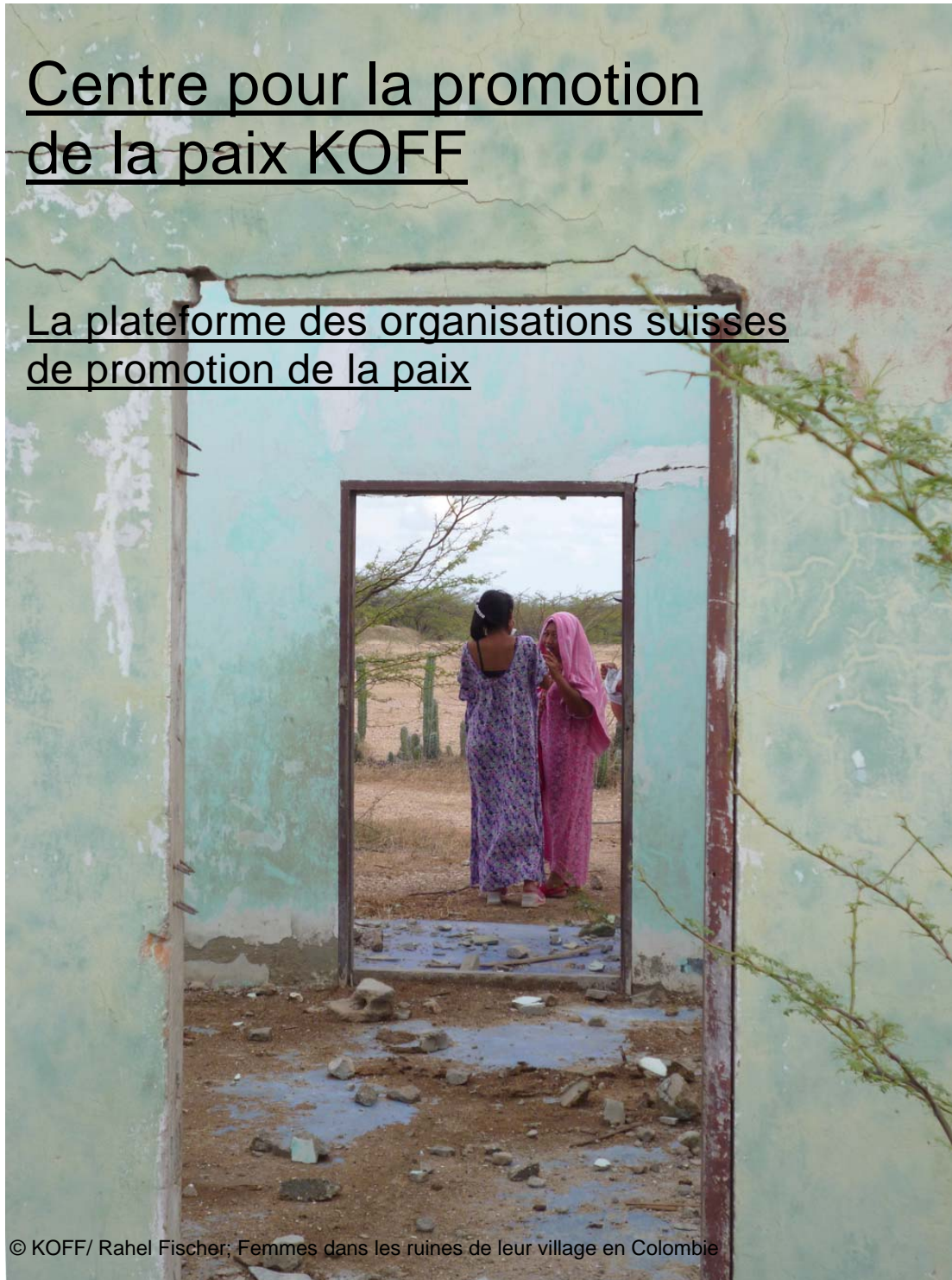
© KOFF/ Rahel Fischer; Femmes dans les ruines de leur village en Colombie

La plateforme des organisations suisses de promotion de la paix